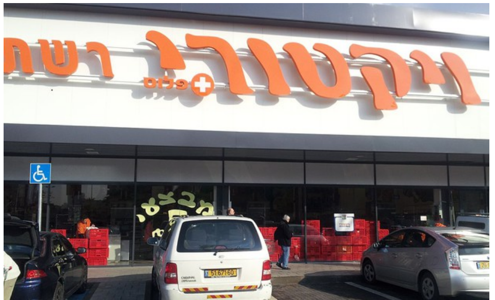
רשתות השיווק הן מפעל חיובי